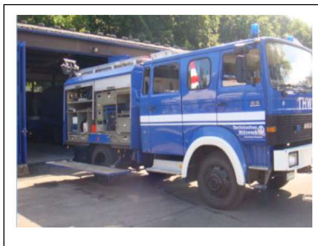
圖 2 參訪 THW 康士坦斯分會

THW 以標準化配備及依各地方災害特性需要給予適當裝備（如圖 2），例如康士坦斯市有博登湖及萊茵河，較易發生水患及土石流等災害，故其裝備需求側重在搶救這類災害所需之車輛及器材，使專業人才得以充分發揮其專業長才執行救災。