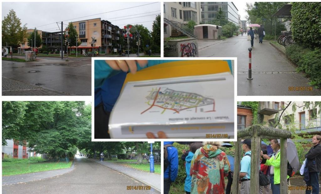
圖 5 弗萊堡廢棄軍營規劃後現狀