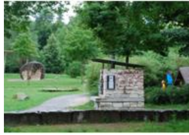
圖 7 幸福的烤麵包爐