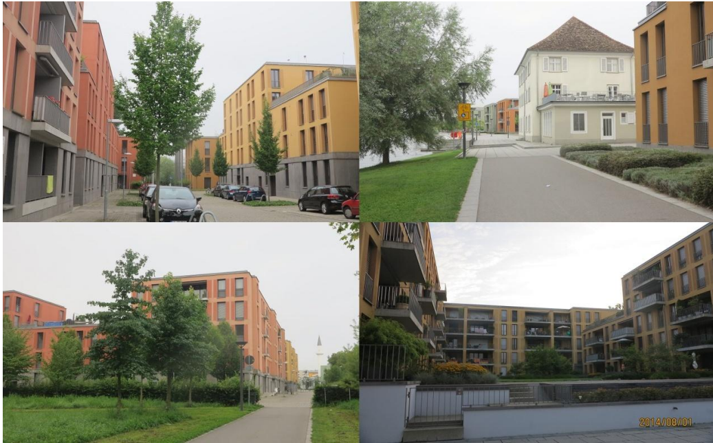
圖 6 康士坦斯市廢棄工業用地規劃後現狀

變更爲住宅、公園等用地，原草案規劃興建 6 棟 U 字型集合住宅，經前述公開討論程序，政府採納民眾意見，將其中 1 棟建築物基地規劃爲公園用地，其餘 5 棟則規劃爲住宅（如圖 6），興建後出售或出租給民眾，以提供民眾住房需求。