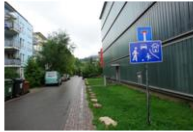
圖 8 友善的標示牌