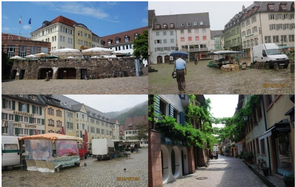
圖 3 弗萊堡舊城保存及維護現狀

需在規劃使用種類強度及規範下使用，始得取得建築執照；私人申請建築重建修繕也必需符合當地制訂相關類別法令規定。以弗萊堡及康士坦斯市古蹟保存區為例（如圖 3、4），其戰後建築物重建、修繕，均需依照建築原樣貌、色彩申請，其最令人佩服的在於民眾及開發商均能謹守政府法令行事。