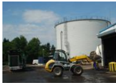
圖 9 綠能的環保廠