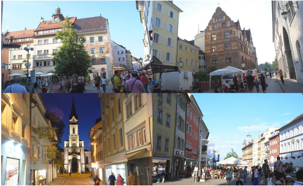
圖 4 康士坦斯市舊城區保存及復建現狀