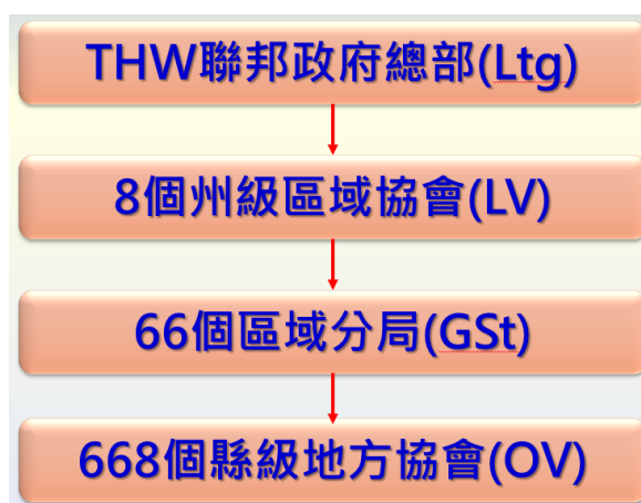
圖 1 德國聯邦技術救援署編制

地方協會是 THW 的基層組織，也是最前線執行任務的救災專業技術中心，應當地政府請求具體負責實施應急救援工作（如圖1） 6 。